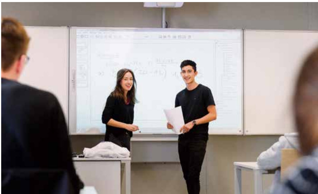
Une nouvelle année scolaire pour les élèves du ceff.

Avec 126 nouveaux contrats, le ceff COMMERCE subit une petite baisse dans ses effectifs par rapport à l'année dernière, et plus précisément dans la filière à plein temps. Les élèves en formation duale sont dans la moyenne des dernières années et sur les 92 nouveaux apprentis duals, 32 ont décidé de choisir la voie avec maturité intégrée. Le domaine de la vente est stable avec 11 nouveaux apprentis gestionnaires du commerce de détail. Le préapprentissage enregistre une belle augmentation avec 28 nouveaux élèves (contre 18 en 2020).