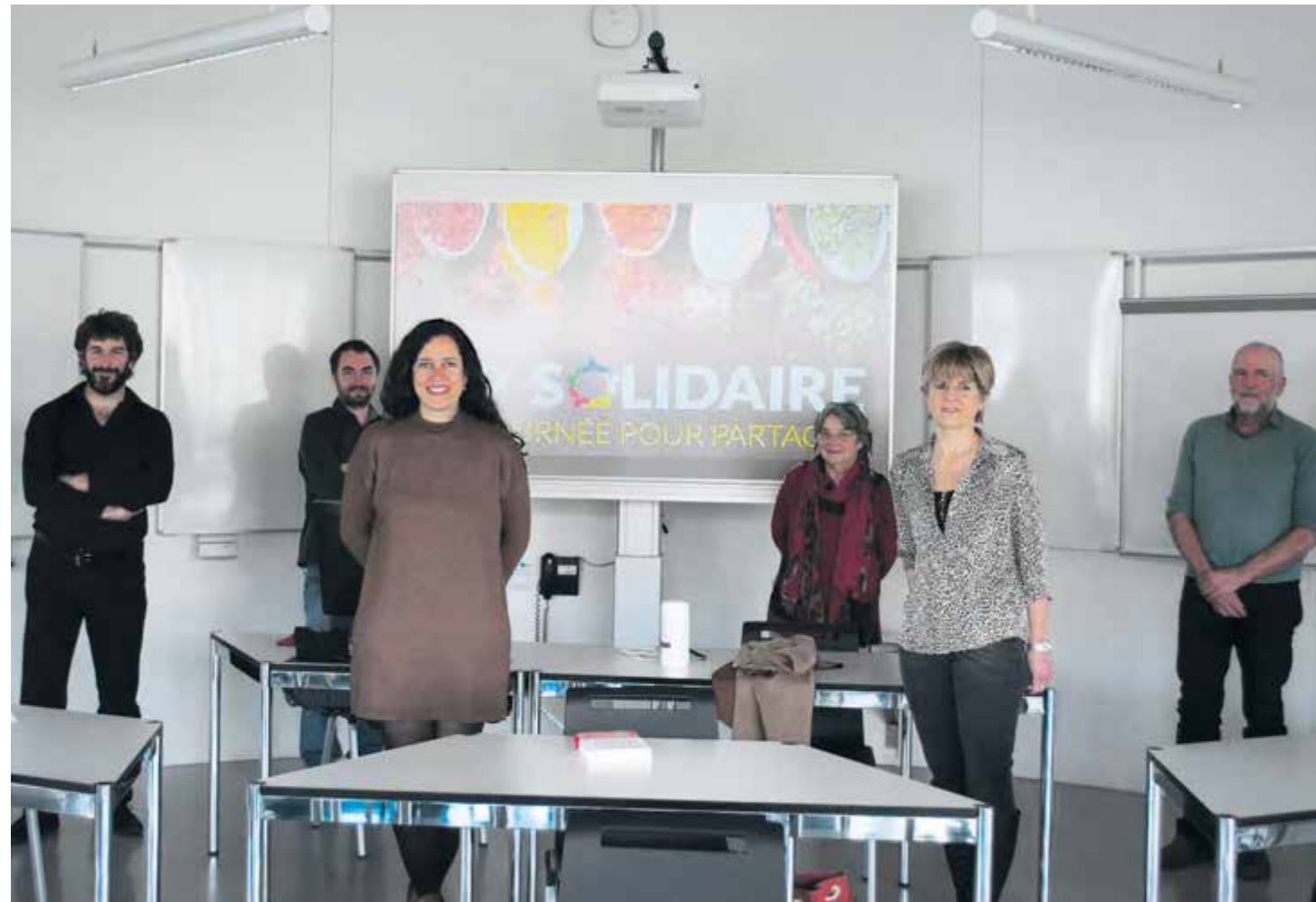
Un comité d'organisation dynamique prêt à vous accueillir

Reportée pour cause sanitaire, la manifestation aura lieu le dimanche 30 mai et réunira 14 associations caritatives au CIP à Tramelan