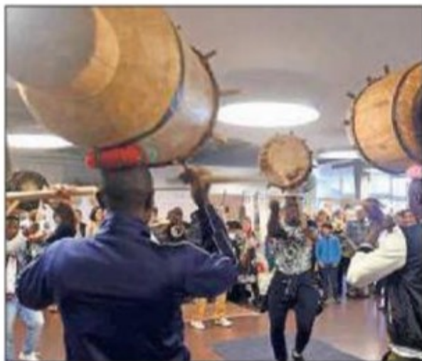
Les tambourinaires du Burundi avaient assuré l'ambiance lors de la dernière édition.

Pour ce qui est des animations, le comité explique avoir dû quelque peu revoir la voilure afin d'éviter de générer des rassemblements. Mais que les gourmets se rassurent: le traditionnel repas de midi concocté par des habitants du centre d'accueil pour requérants d'asile de Tramelan est bel et bien au menu. Il sera toutefois