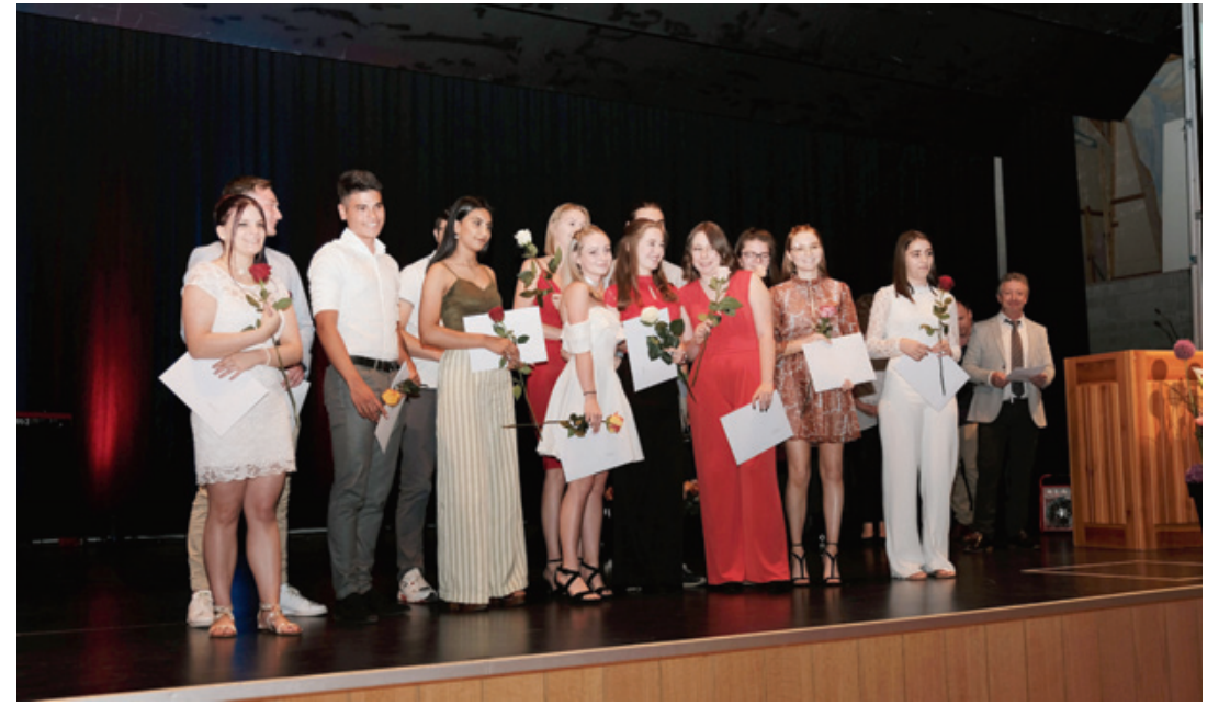
Cérémonie du CEFF Commerce, Salle de la Marelle, Tramelan, 4 juillet 2019.