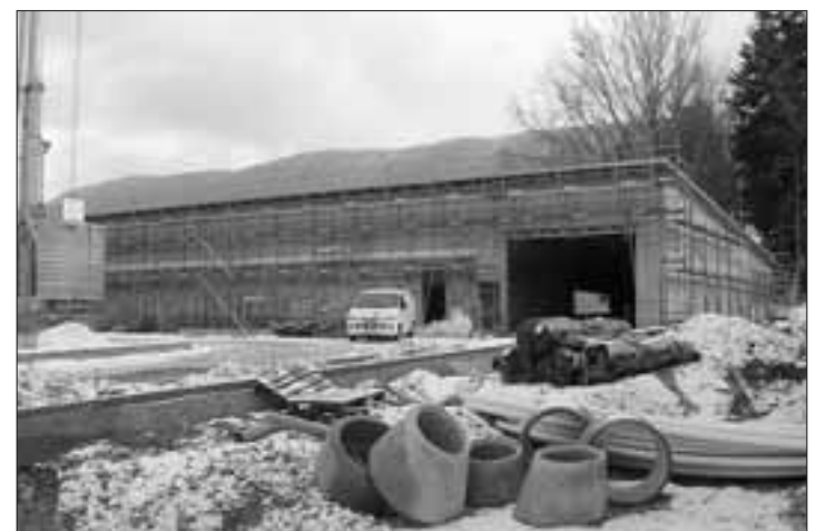
LIDL A l'intérieur comme à l'extérieur, les travaux avancent à un bon rythme.

La maçonnerie et la charpente sont terminées, le toit est posé. La carcasse du hard discounter Lidl se dessine donc aujourd'hui dans l'espace de la Grand-Rue qui lui a été accordé par les citoyens de Reconvilier lors de l'assemblée municipale du 8 décembre 2008.