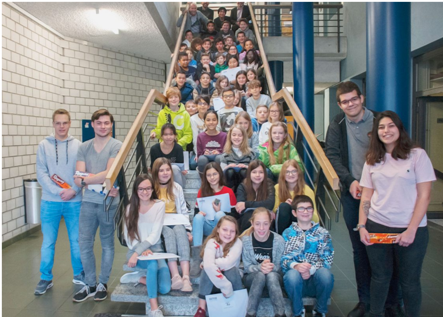
Le staff du ceff au sommet, les jeunes en cascade, les étudiants de l'encadrement au pied de l'escalier.